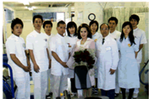
スタッフの皆さん

「胎盤」です。生命の源であり、生理活性物質や細胞増殖因子などが抽出できます。それらが医療用医薬品と