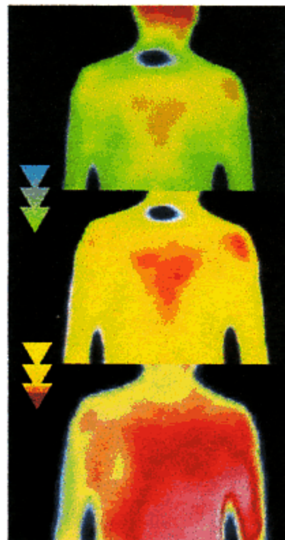
【プラセンタ注射後の体温上昇】

ることに比べて腰痛をも軽減できないかと考えてきました。そこで出会ったのが、第二の選択肢として、代替医療としての胎盤成分を補給する治療法です。胎盤とは、母体が赤ちゃんを育てる神秘の臓器と言われるあの「胎盤」です。これはいまあらゆる効果が認められているのです。