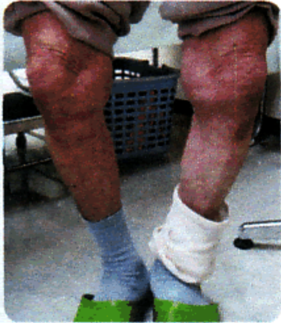
【変形性膝関節症の症例】

ような従来の医学の枠を超えて、さらに部分治療、専門治療という枠も超えて、からだ全体の治癒力を高めることによって腰痛をも軽減できないかと考えてきました。そこで出会ったのが、第二の選択肢として、代替医療としての胎盤成分を補給する治療法です。胎盤とは、母体が赤ちゃんを育てる神秘の臓器と言われるあの「胎盤」です。これはいまあらゆる効果が認められているのです。